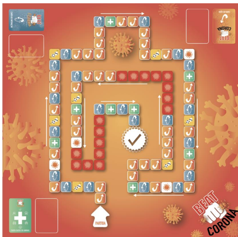
Tabuleiro do jogo "Beat Corona", disponível para download gratuito AQUI . Pode ser jogado por qualquer pessoa a partir dos 10 anos de idade. Design de Celina Botelho.