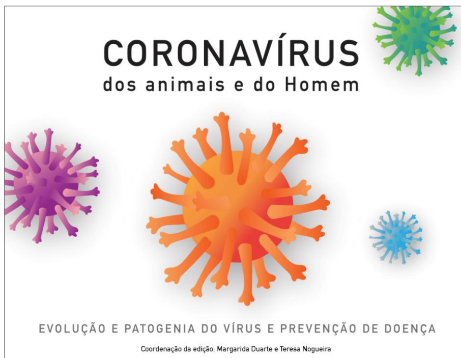
Capa do livro "Coronavírus dos animais e do Homem", disponível para download gratuito AQUI , cuja edição é coordenada por Margarida Duarte (INIAV) e Teresa Nogueira (cE3c & INIAV). Design de Celina Botelho.